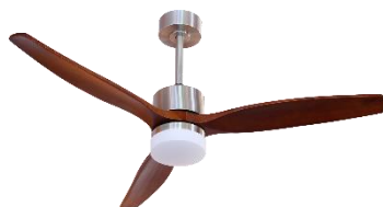
Copenhagen níquel y madera