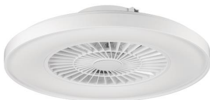
Atlantic blanco Ø604 mm