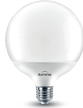
Imagen / Image