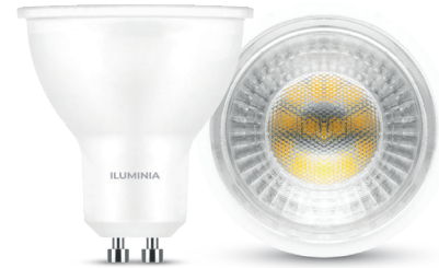
Imagen / Image