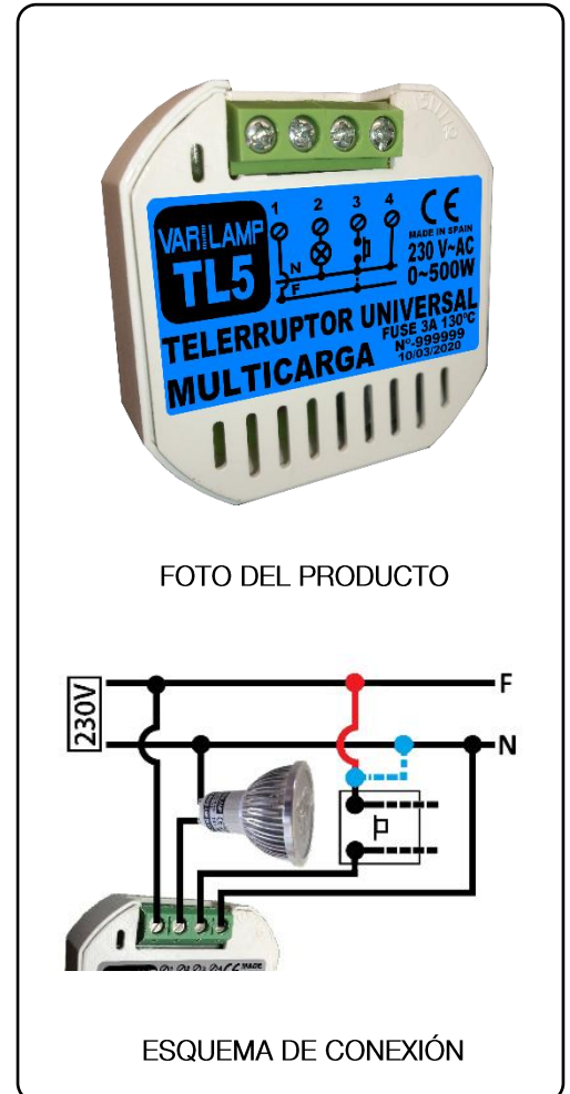
FOTO DEL PRODUCTO

Evita conmutadas y cruzamientos. APTO PARA LED.